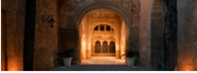
Hotel Alhambra Palace

Das historische Ensemble lädt zu ruhigen Spaziergängen durch die Alhambra ein – doch auch Ausflüge ins UNESCO-Welterbe Albaicín , die Altstadt von Granada oder in die nahe Sierra Nevada beginnen direkt vor der Tür. Schon das Bauwerk selbst, mit seinen Gärten und seinem zauberhaften Interieur, ist ein Erlebnis, das Kultur und Stille zu einem harmonischen Ganzen verbindet.